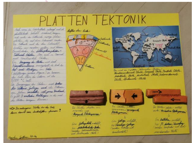
„Collage zur Plattentektonik“ Maarten 6a