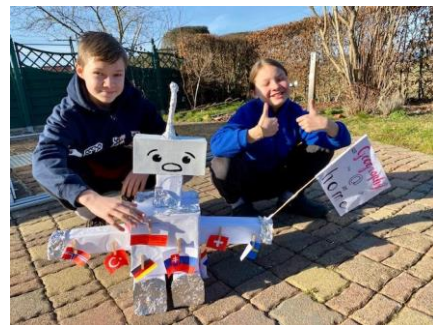
„Geo-Roboter“ Maxim 7b und Mathilda 6b