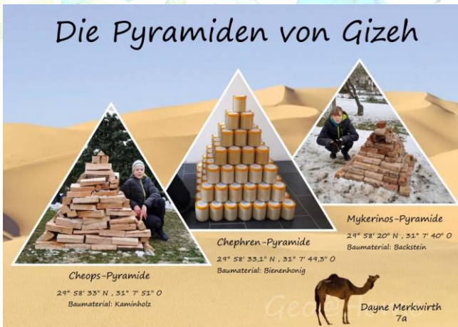
„Pyramiden aus Alltagsmaterial“ Dayne 7a