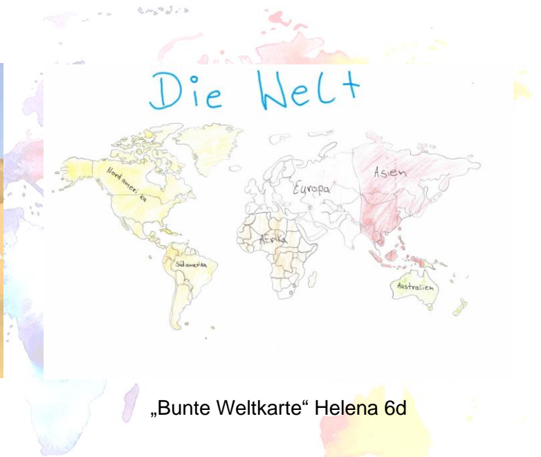
„Bunte Weltkarte“ Helena 6d