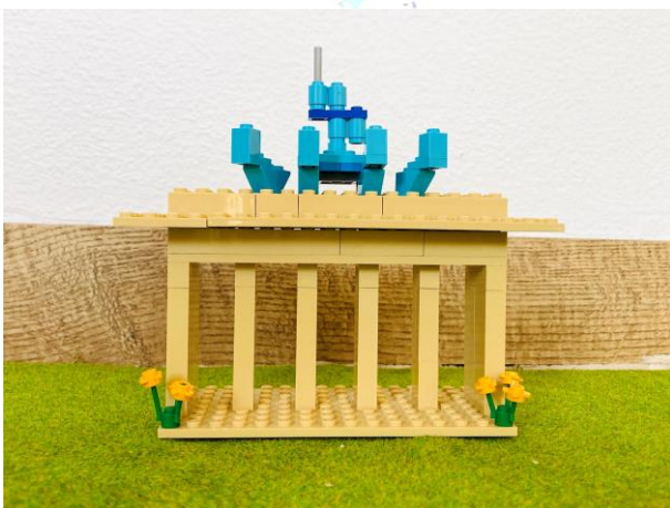
„Brandenburger Lego-Tor“ Jette 7b