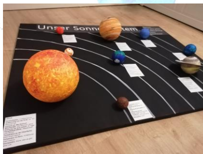
„Unser Sonnensystem“ Levi 5d

Nochmals vielen Dank für euren Einsatz! Eure Geo-Lehrer