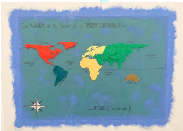
„Weltkarte zum Anfassen“ Tim 5a