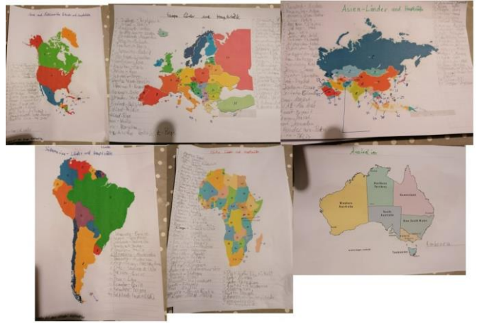
„Topographie weltweit“ Lennard 5b