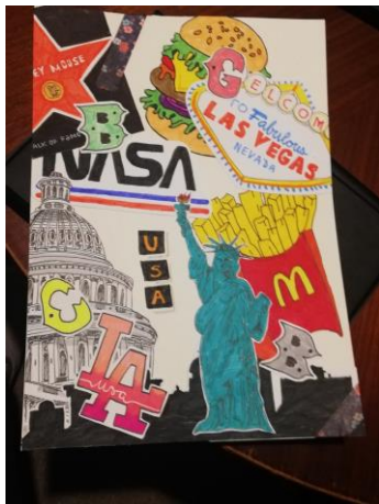
„Collage USA“ Anna 9b