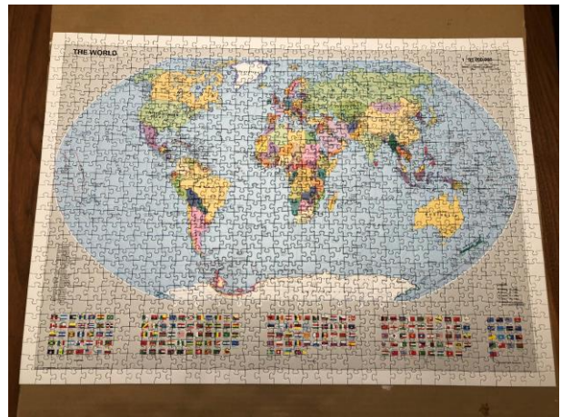
„Geo-Puzzle“ Elena 7c