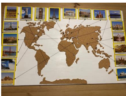
„Weltweite Sehenswürdigkeiten“ Charlotte 6c